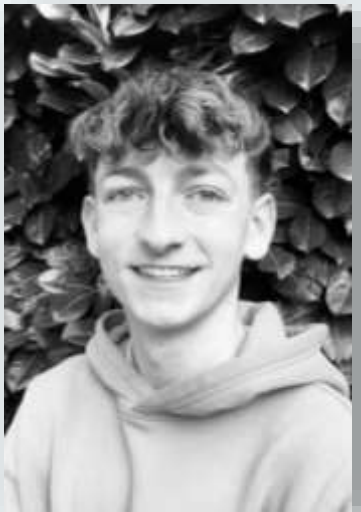
Moritz Geibel Beratung